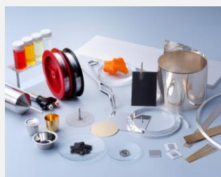
工業用・ 医療用貴金属製品