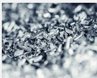
貴金属リサイクル