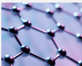
ナノ構造材料製品