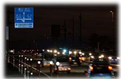
道路標識に使用される 再帰反射シート