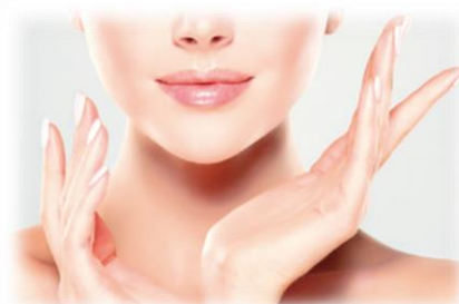
化粧品向け機能樹脂