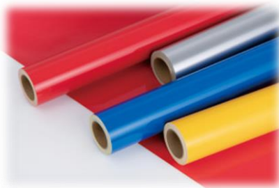
屋外看板に使用される マーキングフィルム