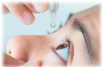
医薬品原体や中間体

世界トップシェアクラスを誇る総合化学メーカー！ 私たちの日常生活をあらゆる分野から支えています。