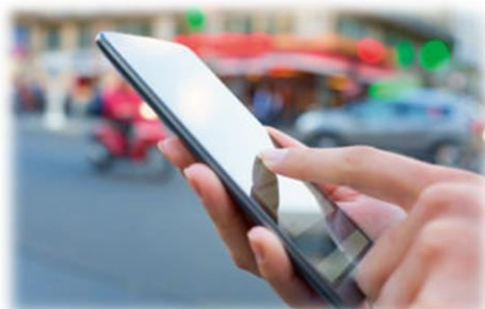
液晶画面の偏光板に使われる 光学フィルム用粘着剤