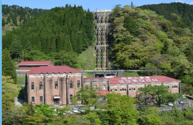
100年以上発電を続ける 水力発電所（東横山発電所）

イビデンは、岐阜県で唯一* 「プラチナくるみん」を取得している民間企業 です。 岐阜労働局のYoutubeチャンネルにて、当社の 取り組みが紹介されています。ぜひご覧ください！