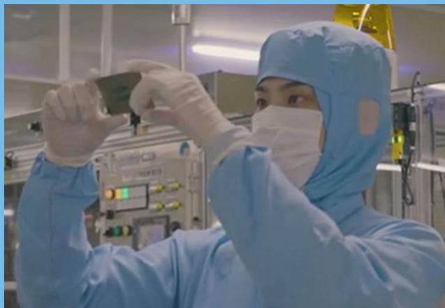
製品のできばえを確認するエンジニア