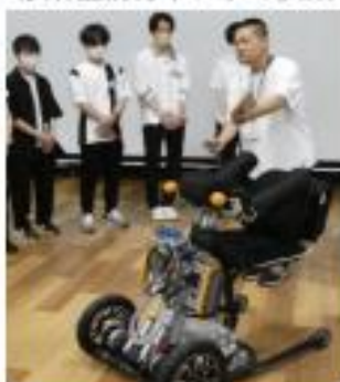
移乗機構付車いすの試乗