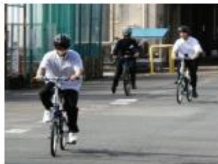
電動自転車の試乗

これまでの主力製品のカットモデルや、小型車用CVT組立ラインの見学など、モノづくりの現場を直接ご覧頂ける貴重な機会となっている他、新規事業として取り組んでいる「電動自転車」と「移乗機構付車いす」の試乗も、予定しております。ジヤトコのモノづくりの醍醐味や技術力の高さ、そして雰囲気を感じて頂きたいと思っております。皆様にお会いできることを楽しみにしております。