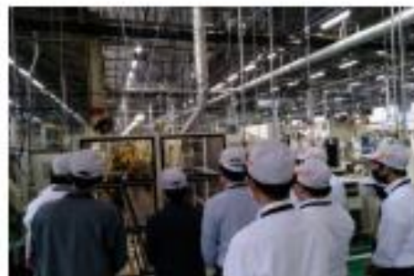
生産ラインを 間近に見ることができる