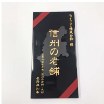
長野県百年企業<信州の老舗>受賞