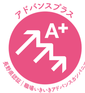
職場いきいきアドバンスカンパニー認証 (最上位認証 アドバンスプラス)