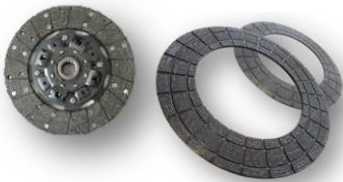
クラッチディスク

Chemical / Medical 化学・医療用 プラント向け 耐薬品性、耐熱性、 屈曲性に優れた フッ素樹脂製品 を化学・製薬工場 での流体制御に適用