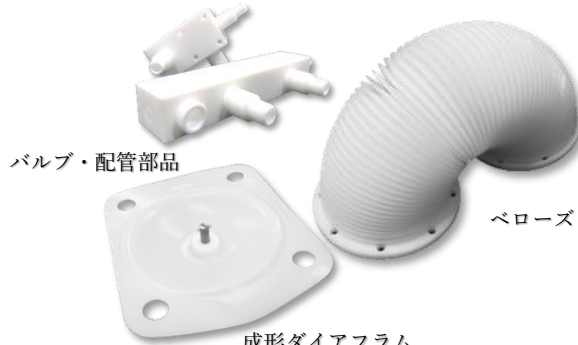
バルブ・配管部品