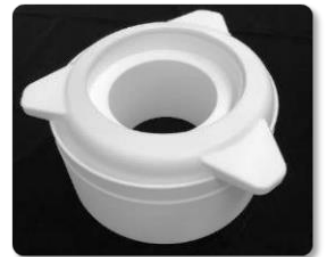
ウェハー洗浄チャンバー