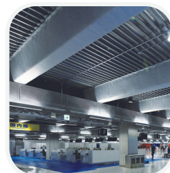
▲施工例 成田空港ターミナル