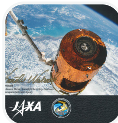
▲製品使用例 JAXA「こうのとりのり」7号機

空港、オフィスビル、商業施設など使用される建築用の耐火材のほか、火力発電所や製鉄所、石油化学プラントなどでは、高温下で使用される断熱材として高い信頼を寄せられています。また最近では、製品の一部に“断熱材”を使用した応用製品の分野でも売上を大きく伸ばしています。