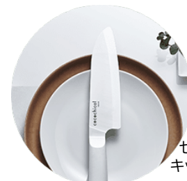
セラミック キッチン用品