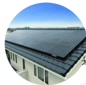
住宅用 太陽光発電 システム