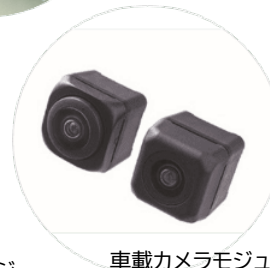
車載カメラモジュール