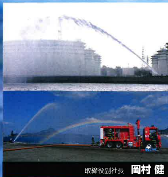
取締役副社長 岡村 健