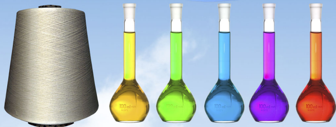
紡績・テキスタイル分野

本 社 大阪市中央区備後町三丁目2番6号 創立年月日 1892年(明治25年)8月5日 資 本 金 113億3600万円 上場区分 東京証券取引所プライム市場 事業内容 繊維事業、産業資材事業 機能材料事業、研究開発 不動産・サービス事業