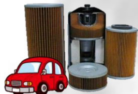
自動車用フィルター