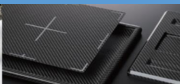
CFRP製医療用カセット